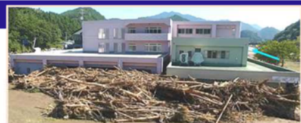
平成28年台風10号により、岩手県の要配慮者利用施設では利用者9名の全員が死亡。