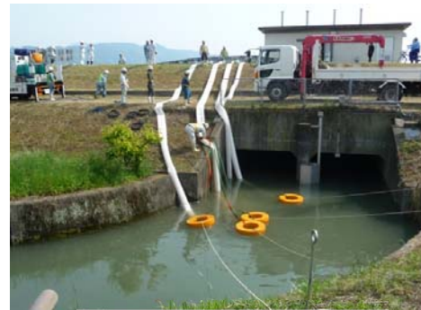
排水ポンプ車設置訓練