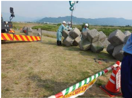
無人玉外しフック操作訓練