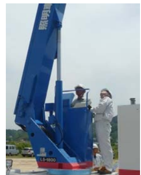
照明車操作訓練の様子