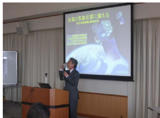
船本防災管理官による、防災気象情報・気象予報に関する講座の様子