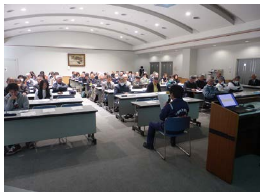
出水シミュレーションの様子