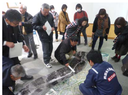
昭和18年、20年の重信川決壊の被害痕跡が残る 昭和20年の写真と現在の写真を見比べている様子