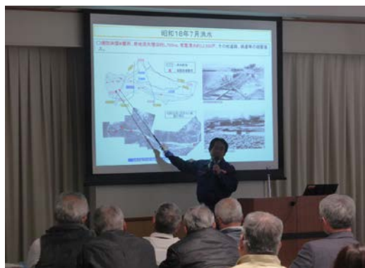
「重信川の被害想定や防災への備え」の説明