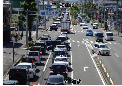
国道33号は渋滞が発生