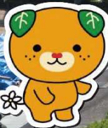
愛媛県イメージアップキャラクター みぎやん