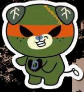
愛媛県 ダークみぎやん