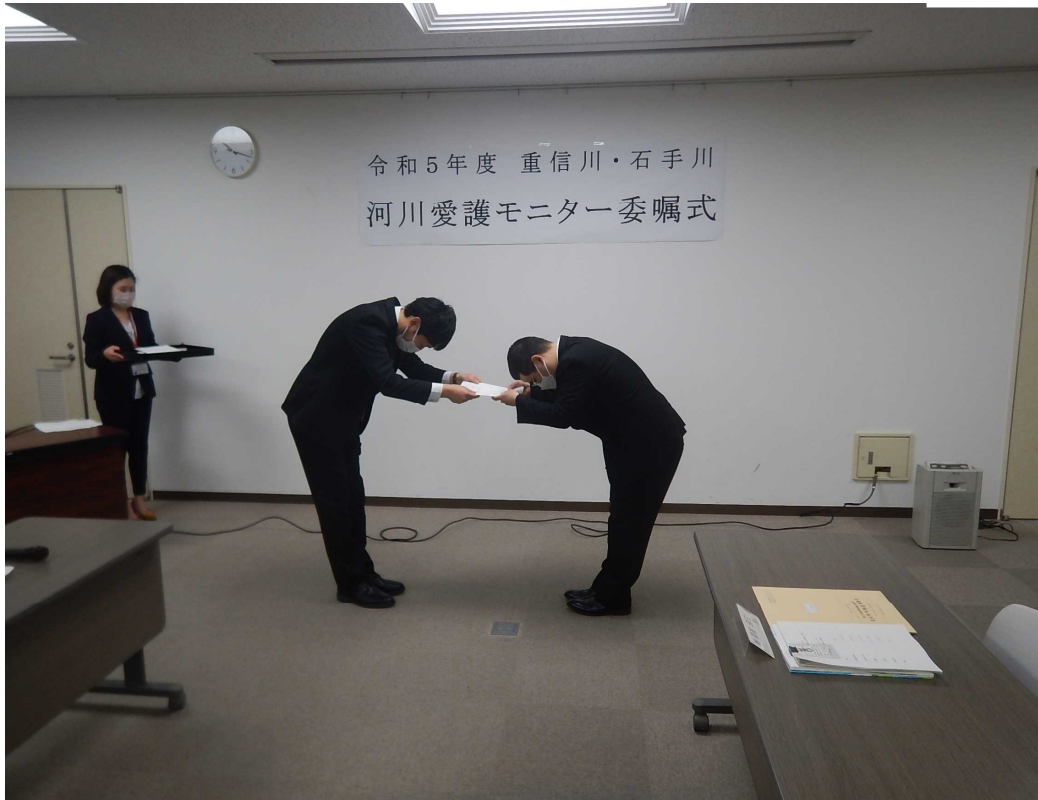
R5年度 河川愛護モニター委嘱状授与