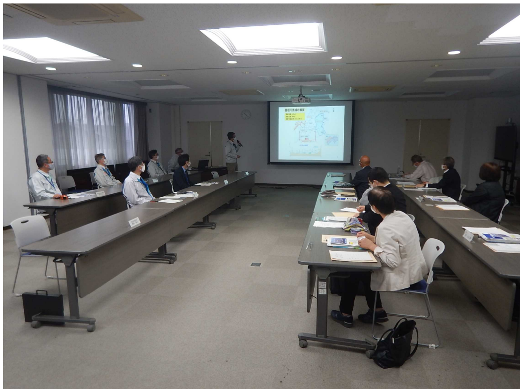
R5年度 河川愛護モニター説明会