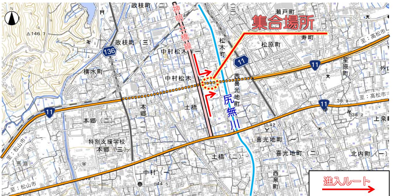
この地図は、国土地理院の地理院地図に加筆したものである。