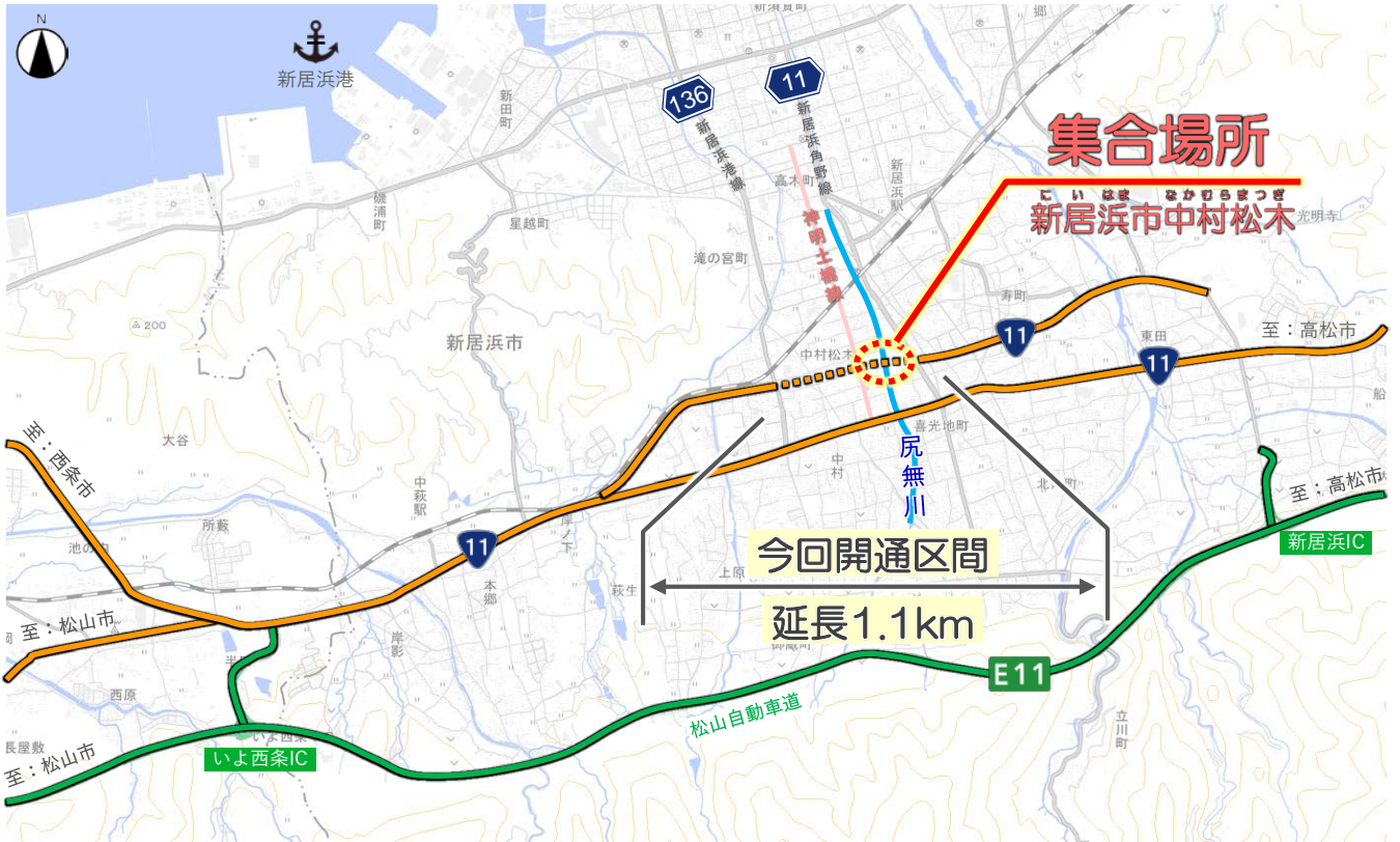
この地図は、国土地理院の地理院地図に加筆したものである。