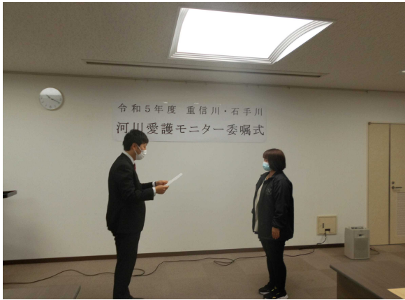
事務所長より委嘱状を受け取ります。