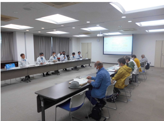
途中で意見交換会を行います。（年に1回）