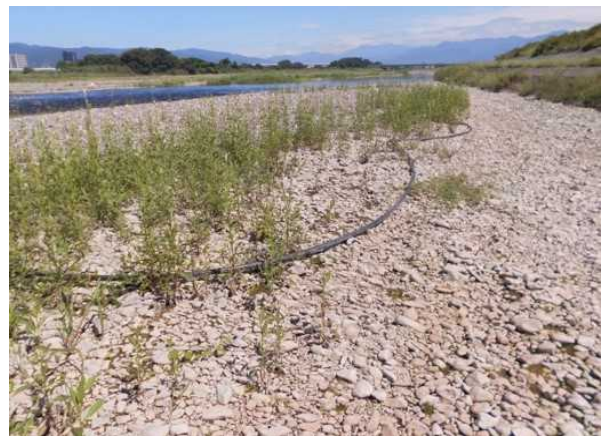
モニター報告を受けて河川内のゴミを撤去しました。（写真の黒いパイプ）