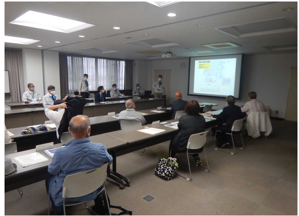
河川の概要やモニター心得についての説明を聞きます。