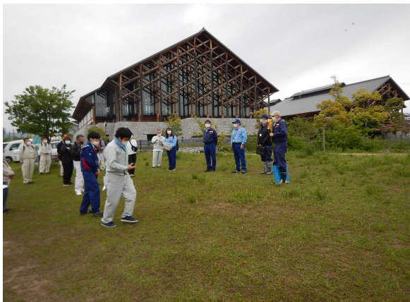
普段のモニター活動に加えて、職員とともに安全利用点検を行います。（年に1～2回）