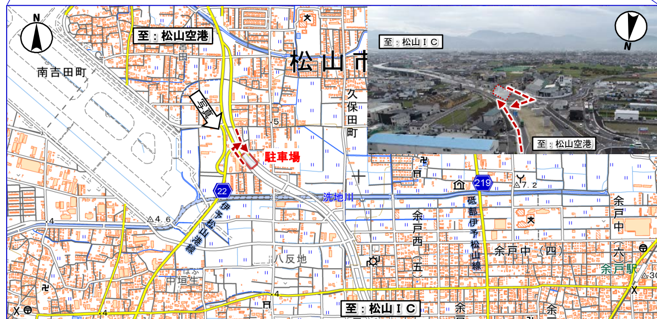
この地図は、国土地理院の地理院地図に加筆したものである。