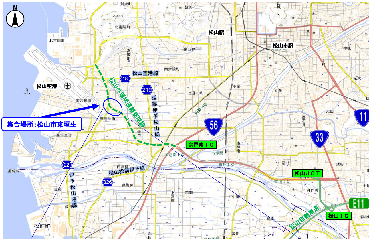
この地図は、国土地理院の地理院地図に加筆したものである。