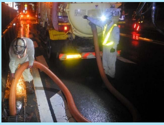
維持作業(排水管清掃)