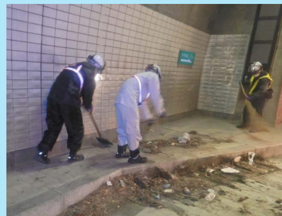
維持作業(路面清掃)