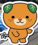
愛媛県イメージアップキャラクター みぎやん