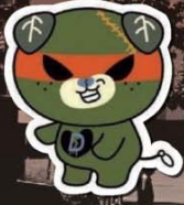
愛媛県 ダークみぎやん