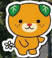
愛媛県 イメージアップキャラクター みきやん