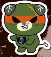
愛媛県 ダークみきやん