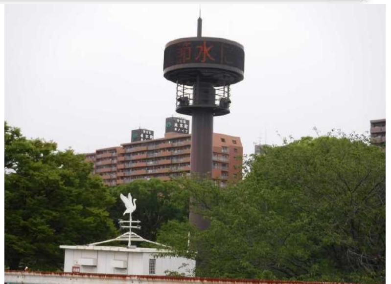
②中村放流情報表示装置