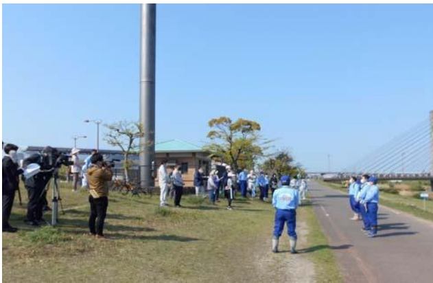
普段のモニター活動に加えて、職員とともに安全利用点検を行います。（年に1~2回）