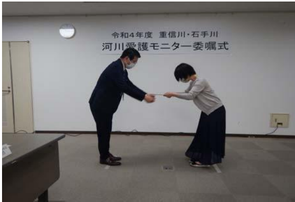
事務所長より委嘱状を受け取ります。