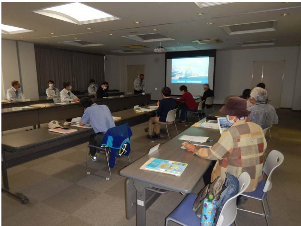
河川愛護モニタ一説明会