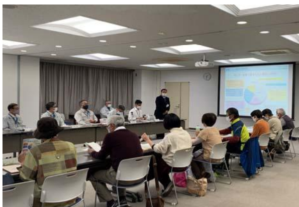
途中で意見交換会を行います。（年に1回）