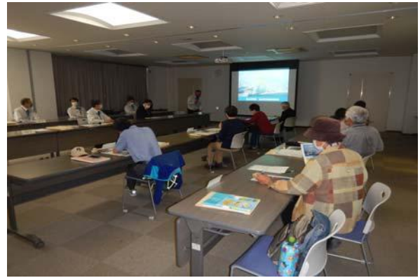
河川の概要やモニター心得についての説明を聞きます。