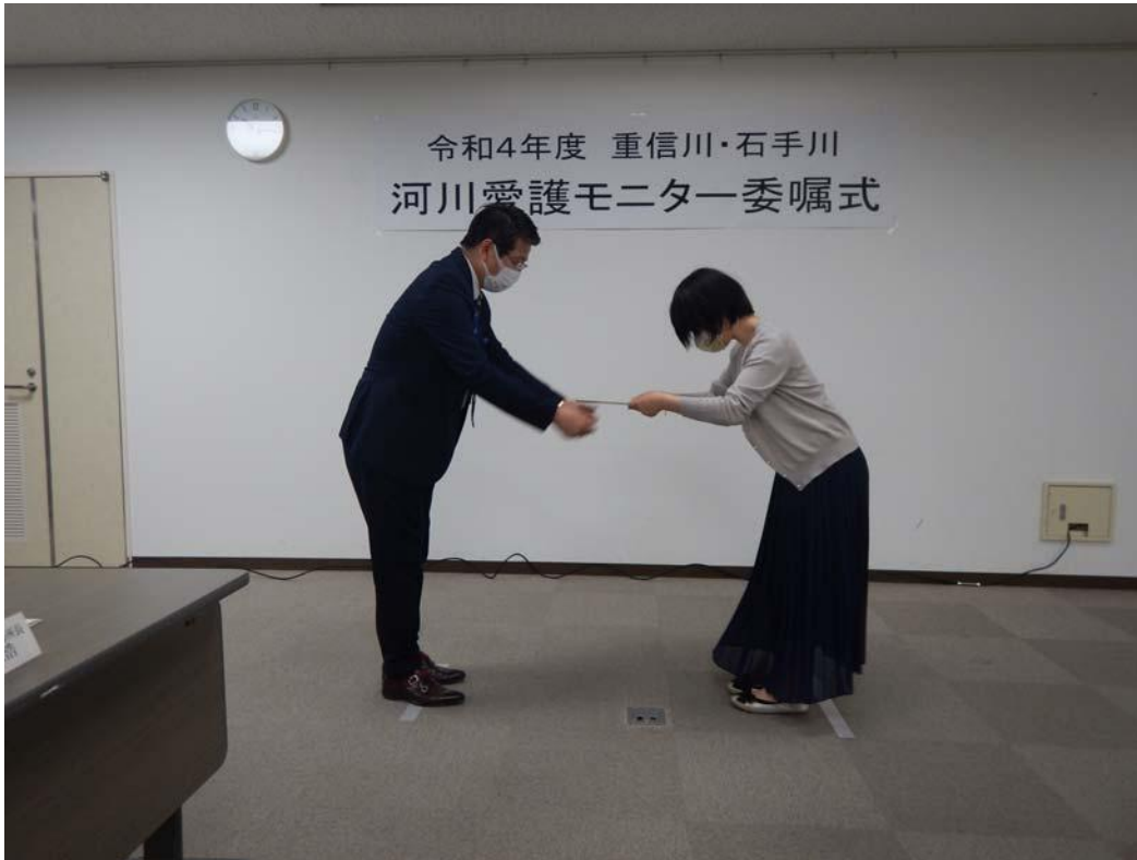
河川愛護モニタ一委嘱式