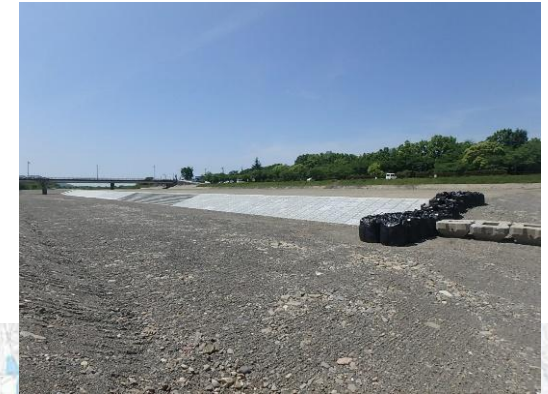
かわまちづくり (高水敷、低水護岸整備)