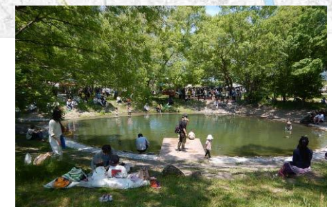
開発霞 (だんだん池)