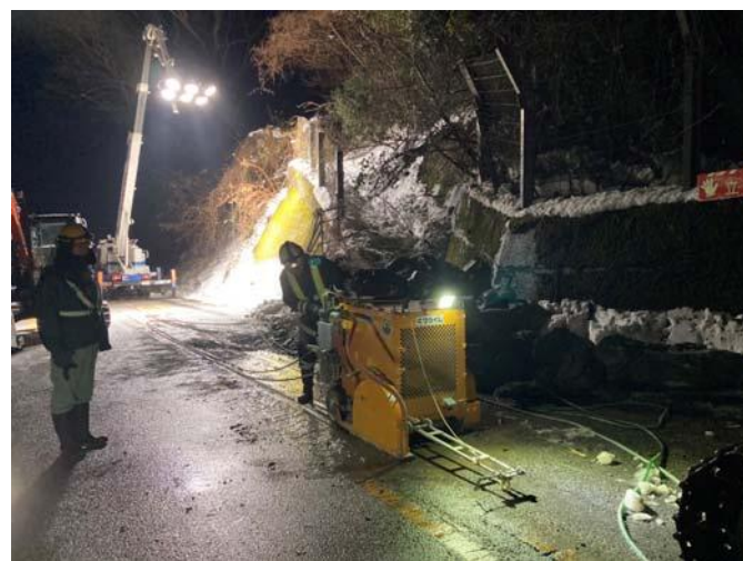
カッター作業状況