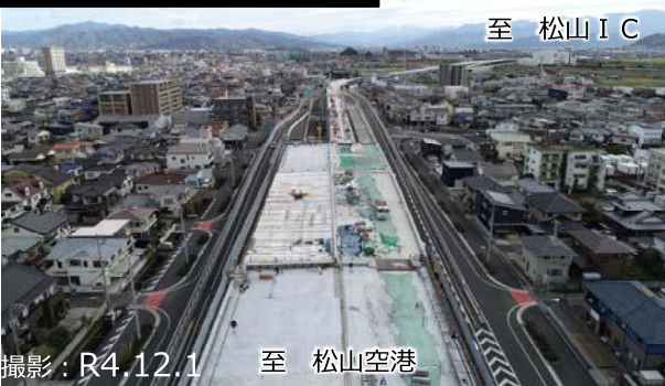
写真② ひがしはぶ 東垣生 I C 付近