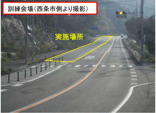
訓練会場(西条市側より撮影)

【訓練会場】 とうおん かわのうち (愛媛県東温市河之内 国道11号 登坂車線)