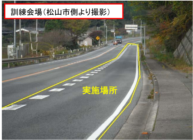
訓練会場(松山市側より撮影)