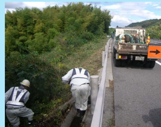
維持作業(水路清掃)