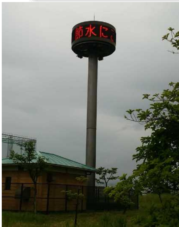
①中央公園放流情報表示装置