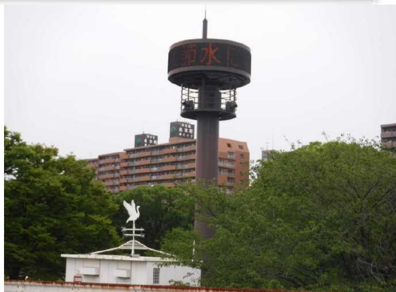
②中村放流情報表示装置