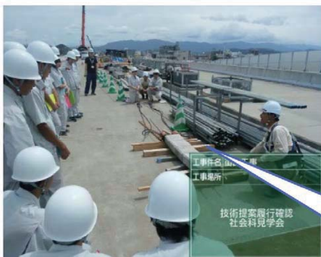
コンクリートブロックを用いて鋼棒を緊張している様子

コンクリートは内側へ圧縮する力には強いですが、外側へ引っ張られる力には弱いという特徴があります。そこで、PC 鋼棒と呼ばれる棒をボックスに通して引っ張り固定します。すると鋼棒は元に戻ろうとするので、コンクリートにも圧縮される力が働きます。この「引っ張られる」状態を緊張と呼びます。当日は、コンクリートブロックを用いて簡易的な緊張作業を見学していただきます。