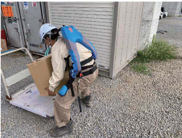
パワーアシストスーツを装着すると...

建設現場にパワーアシストスーツを導入することで、生産性の向上や作業員の疲労軽減などに貢献しています。当日は、パワーアシストスーツを装着してもらい、人力作業を体験していただきます。