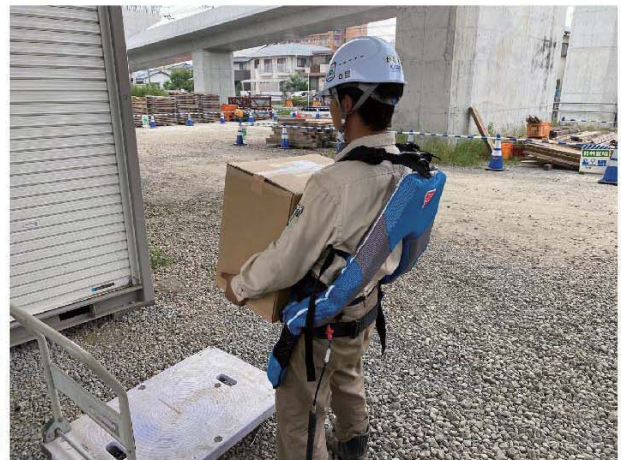
重たい荷物も軽々と持てます！