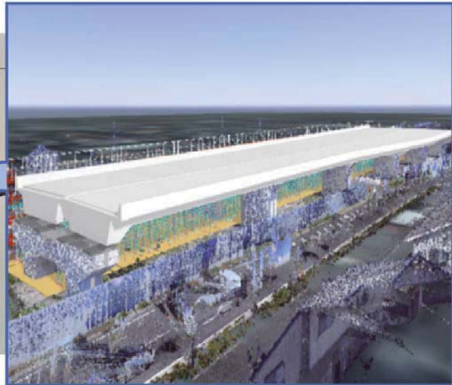
完成イメージを360度の映像で体感！