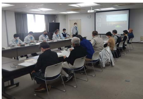
途中で意見交換会を行います。(年に1回)