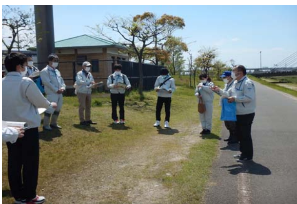
普段のモニター活動に加えて、職員とともに安全利用点検を行います。(年に1~2回)