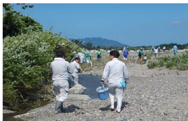
重信川クリーン大作戦にご案内します。(年に2回)