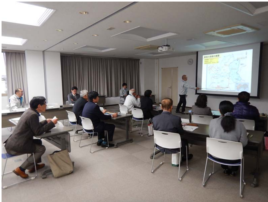
河川愛護モニタ一説明会