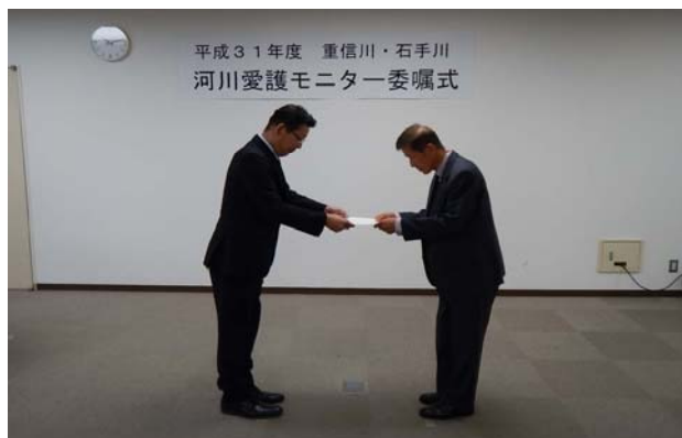
事務所長より委嘱状を受け取ります。