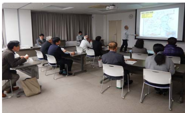
河川の概要やモニター心得についての説明を聞きます。