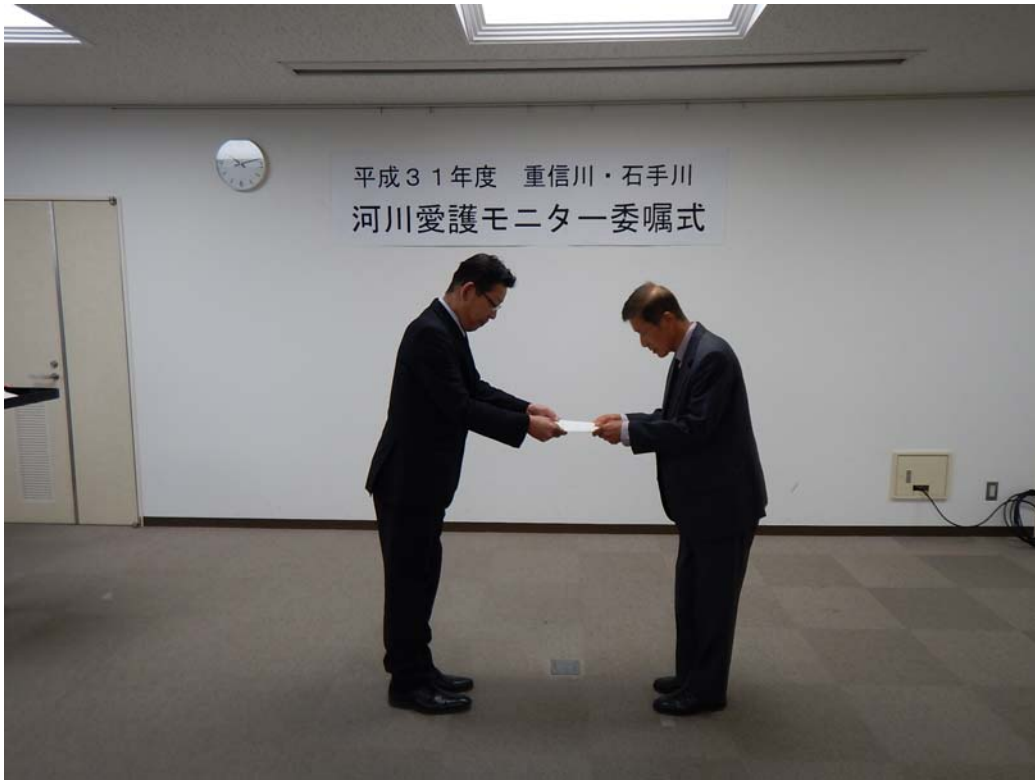
河川愛護モニタ一委嘱式