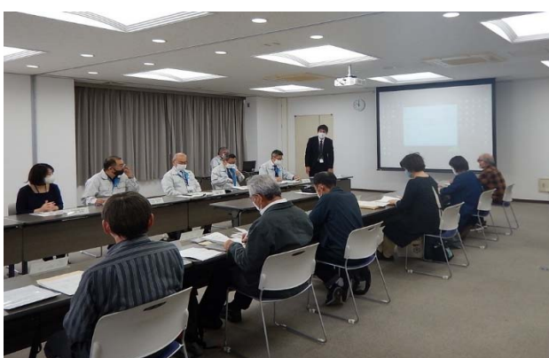
途中で意見交換会を行います。(年に1回)