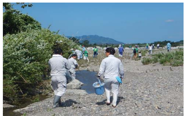
重信川クリーン大作戦にご案内します。（年に2回）