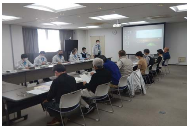
途中で意見交換会を行います。（年に1回）