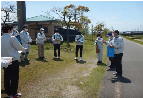
普段のモニター活動に加えて、職員とともに安全利用点検を行います。（年に1～2回）