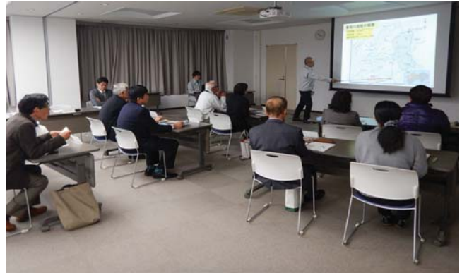
河川の概要やモニター心得についての説明を聞きます。