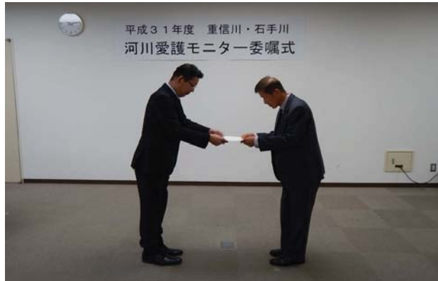
事務所長より委嘱状を受け取ります。