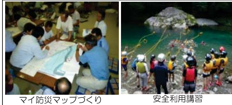
マイ防災マップづくり