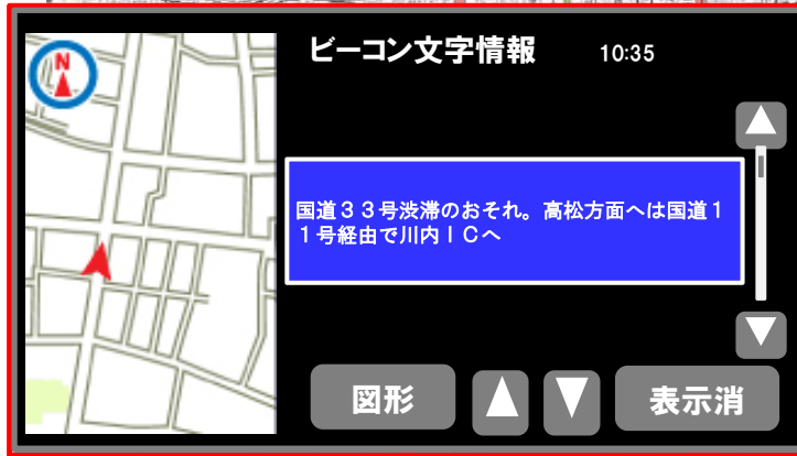
VICS情報提供イメージ