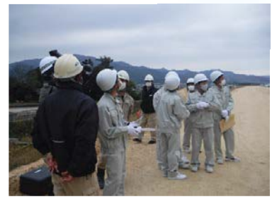
ドローン撮影・操縦体験