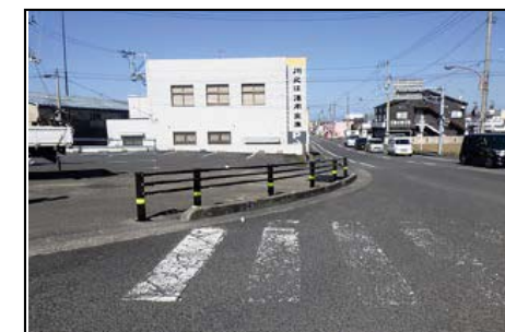
対策イメージ：ガードパイプ 愛媛県 国道11号の施工状況