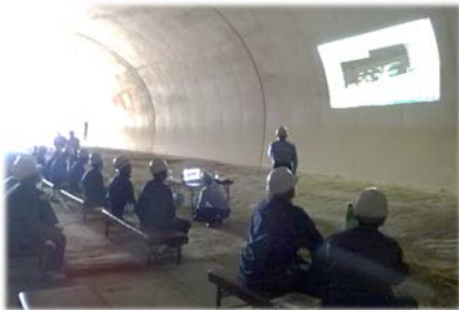
最新i-Construction講座 (朝倉トンネル内)