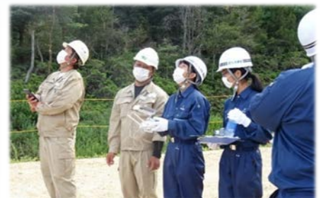
ドローン撮影・操縦体験