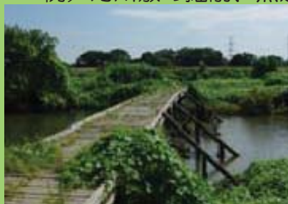
ピオトープの整備