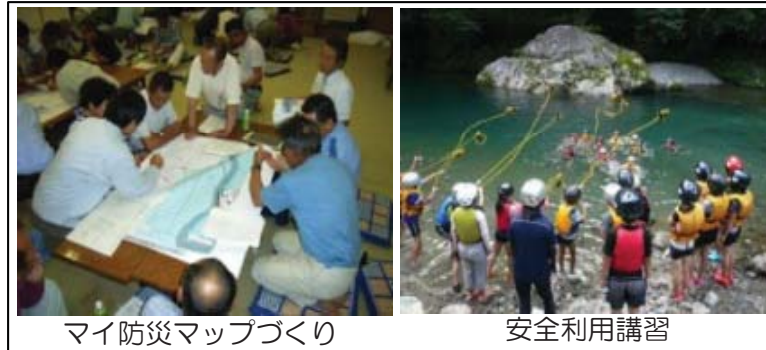
マイ防災マップづくり