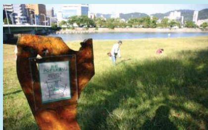
市民団体による看板設置事例（太田川）