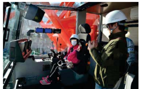
クレーン搭乗体験