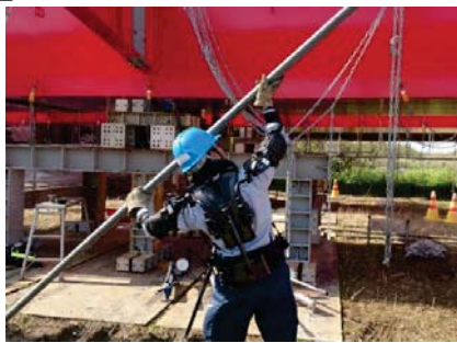
パワーアシストスーツ装着体験