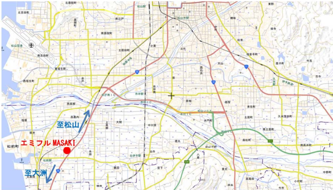
この地図は国土地理院の地理院地図に加筆したものである