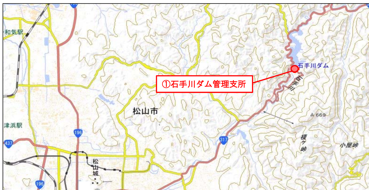
※この地図は国土地理院図（電子国土Web）に加筆したものである。