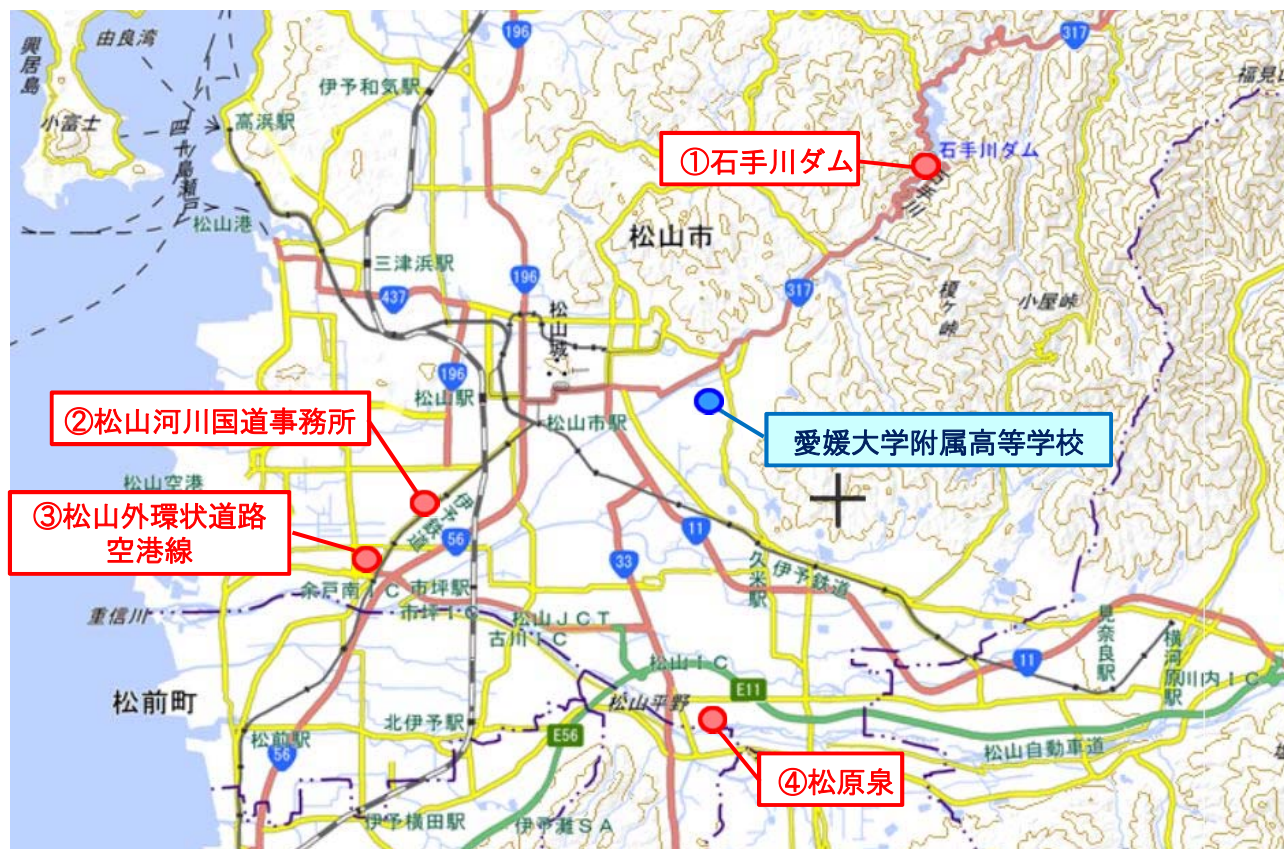
※この地図は国土地理院図（電子国土Web）に加筆したものである。