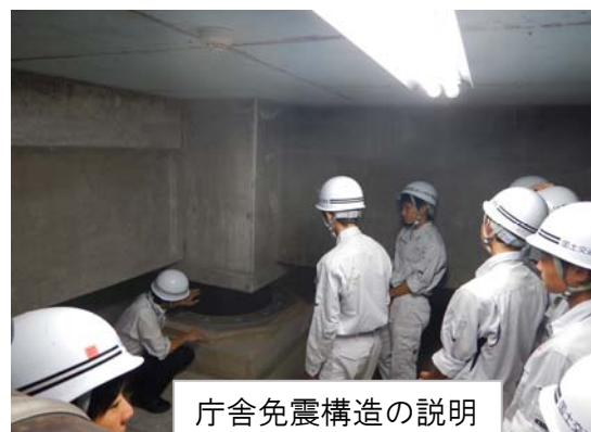
庁舎免震構造の説明