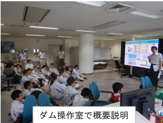
ダム操作室で概要説明