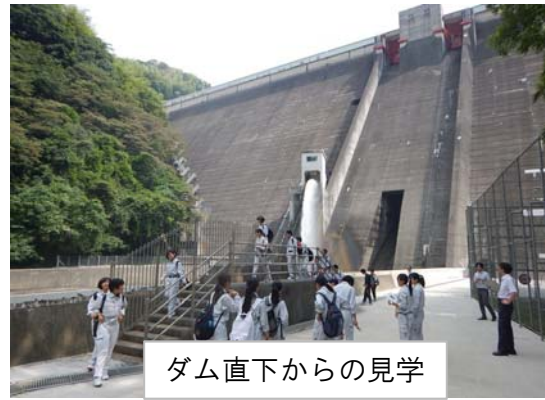
ダム直下からの見学