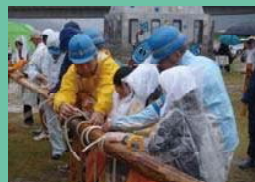
ロープワーク体験