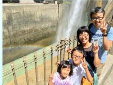
「石手川ダムにかかる二本の虹」