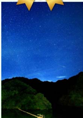
「白鷺湖とペルセウス座流星群 2018」