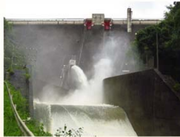
「ダム・只今、元気に放流中！」