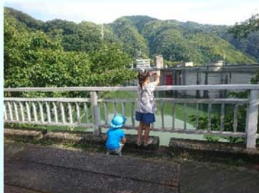
「どこから撮るのがいいかなあ」