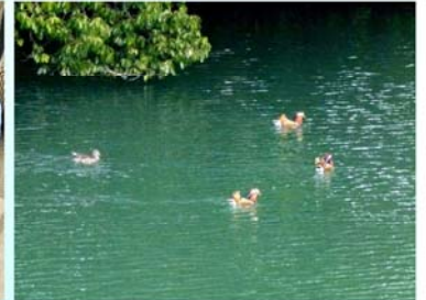
「だんな様、よいどりみどり♡」