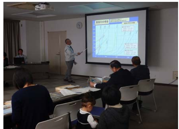
河川の概要やモニター心得についての説明を聞きます。