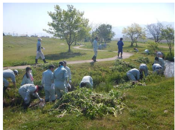
重信川クリーン大作戦にご案内します。（年に2回）