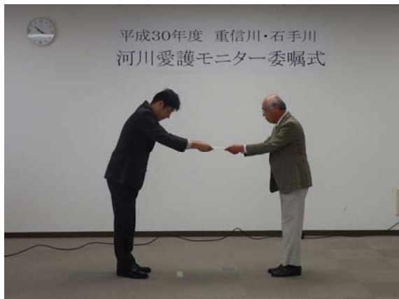
事務所長より委嘱状を受け取ります。