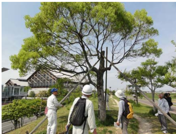
普段のモニター活動に加えて、職員とともに安全利用点検を行います。（年に1～2回）