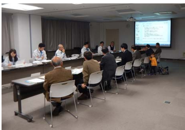
途中で意見交換会を行います。（年に1回）