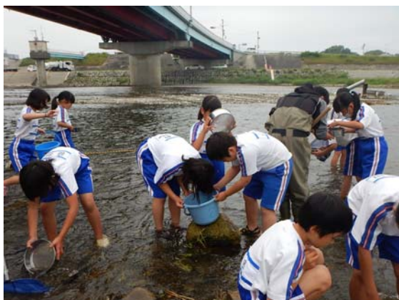
出合（松山市立さくら小学校）