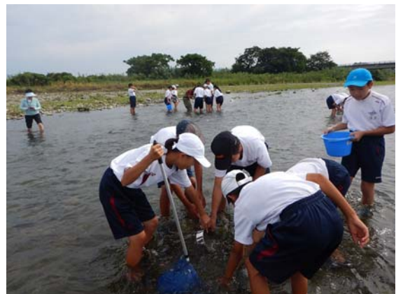
中川原（松山市立椿中学校）