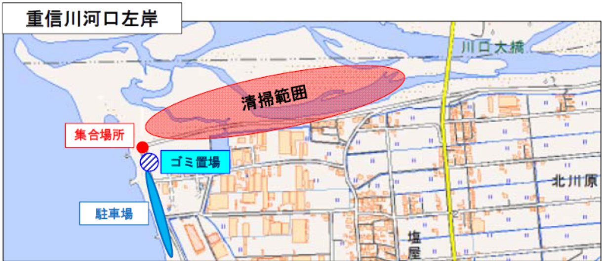
※この地図は国土地理院図（電子国土Web）に加筆したものである。