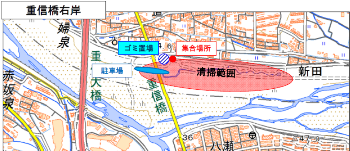
※この地図は国土地理院図（電子国土Web）に加筆したものである。