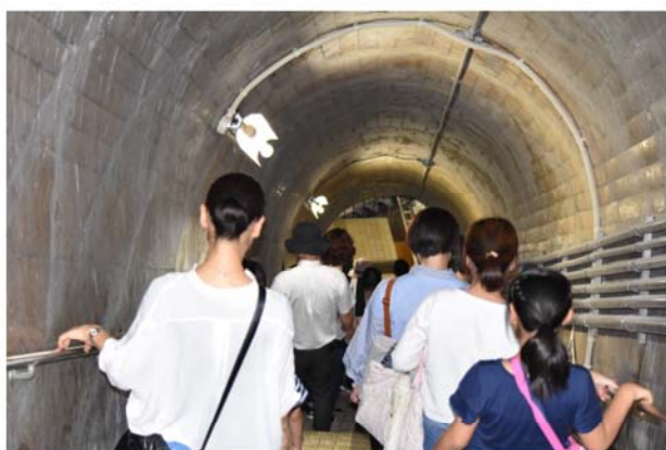
監査廊内を移動中