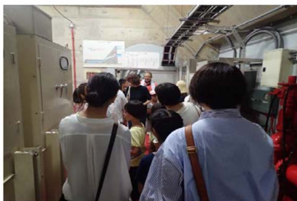
ダム堤体内で各ゲートの説明