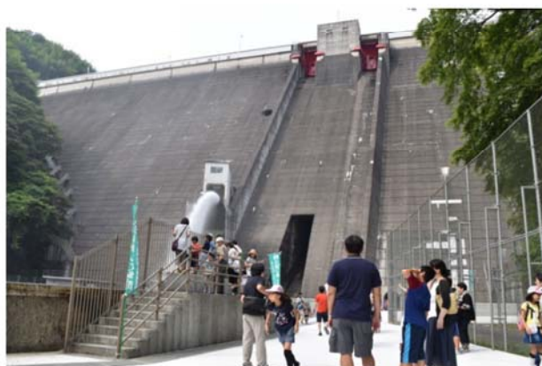
ダム直下にて放流見学