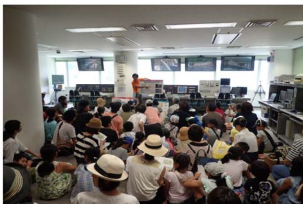
操作室にてダムの説明中