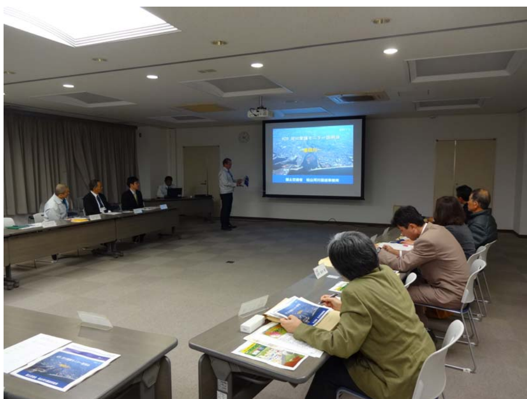
河川愛護モニター説明会