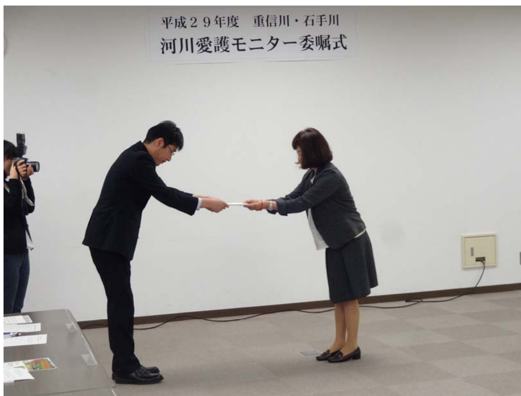
河川愛護モニター委嘱式