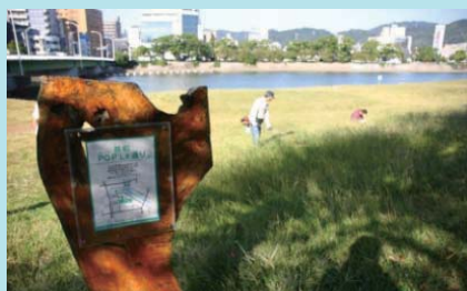
市民団体による看板設置事例（太田川）