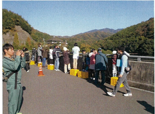
昨年の観察会の様子