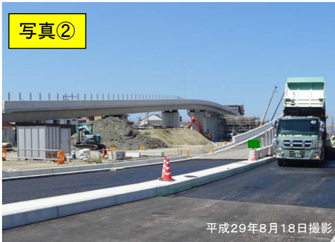
▲国道56号より空港方面を望む