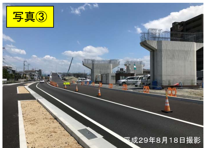
▲ くめはぶ 県道久米垣生線より松山IC方面を望む