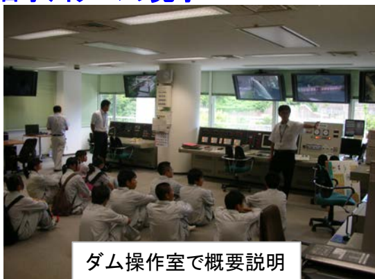
ダム操作室で概要説明