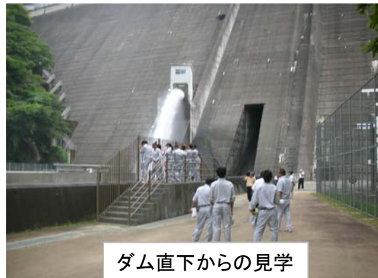
ダム直下からの見学