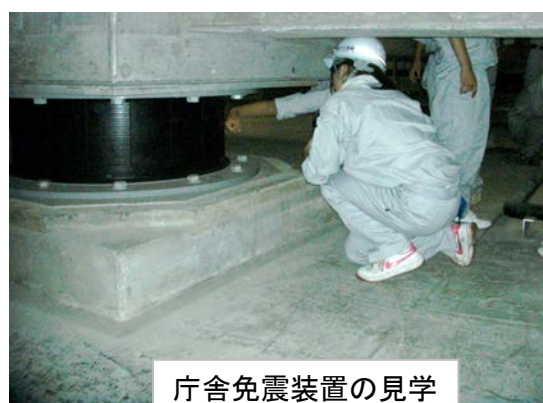
庁舎免震装置の見学