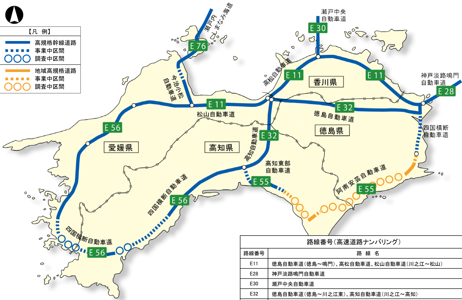
路線番号(高速道路ナンバリング)