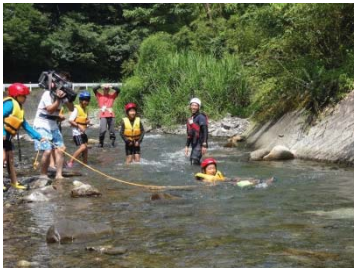
スローバックを活用した救助訓練