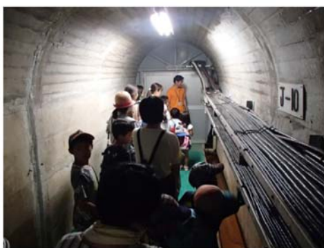
監査廊内を移動中