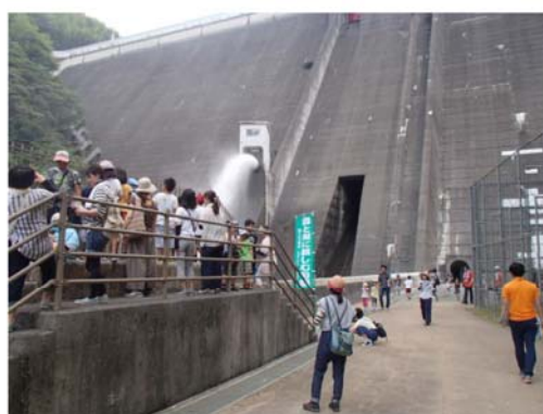
ダム直下にて放流見学