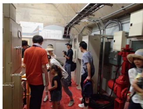
ダム堤体内で各ゲートの説明