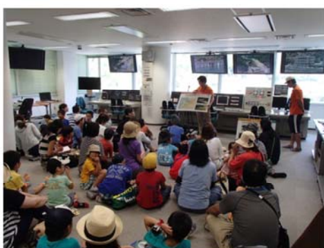
操作室にてダムの説明中