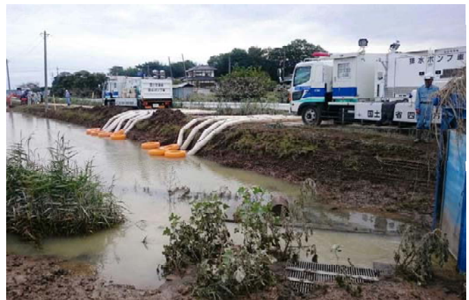
写真－1 平成27年9月 関東豪雨災害(鬼怒川堤防決壊)での排水支援(茨城県常総市)