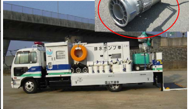
排水ポンプ車写真