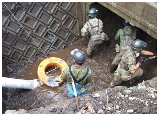
写真－2 平成24年7月 九州北部豪雨での排水支援(熊本県阿蘇市一の宮)