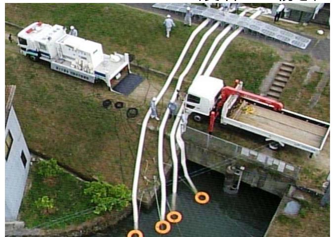
写真－3 過去の訓練の様子・全景