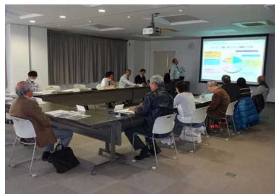
途中で意見交換会を行いますので、参加して気付いたことを遠慮なく話し合ってください。（年に1回）