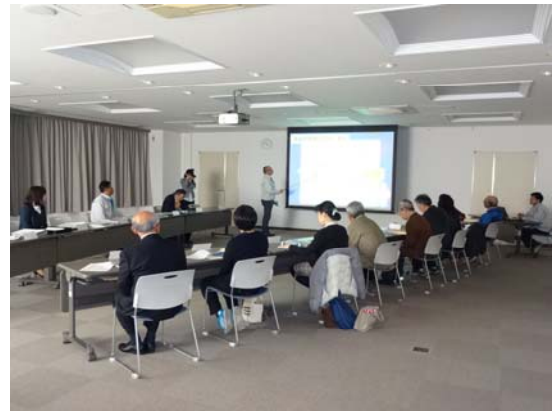
河川の概要やモニター心得についての説明を聞きます。