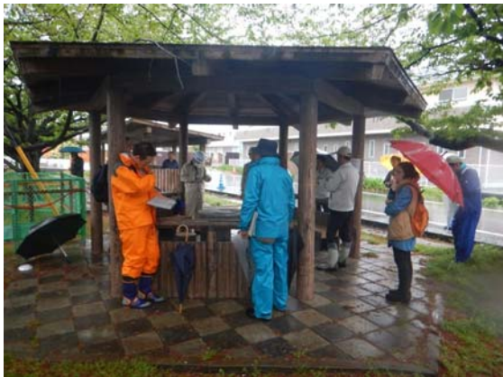
普段のモニター活動に加えて、職員とともに安全利用点検等を行います。（年に2回程度）