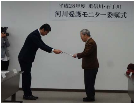
事務所長より委嘱状を受け取ります。