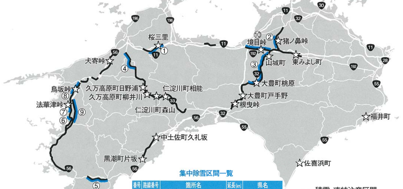
集中除雪区間一覧