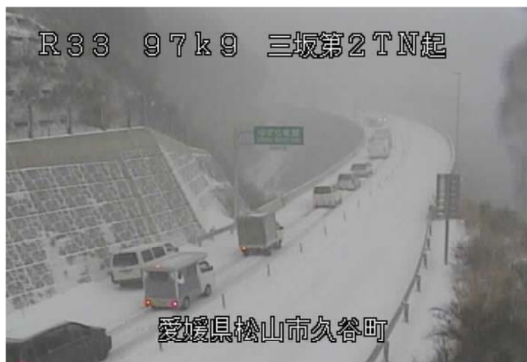
降雪による渋滞発生状況