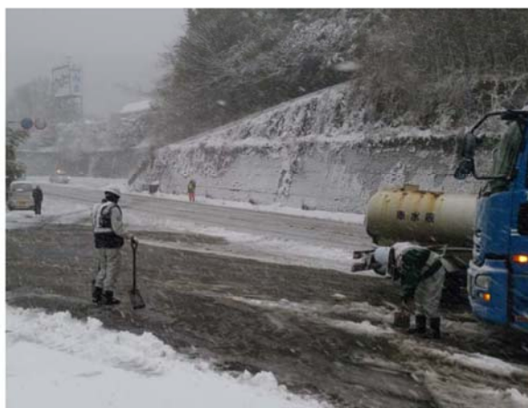
スコップ隊の除雪作業状況