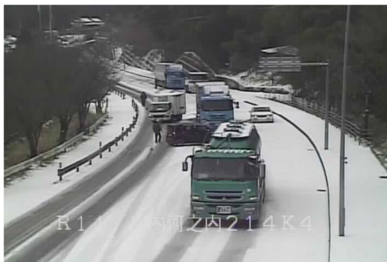
立ち往生寸前の車輻