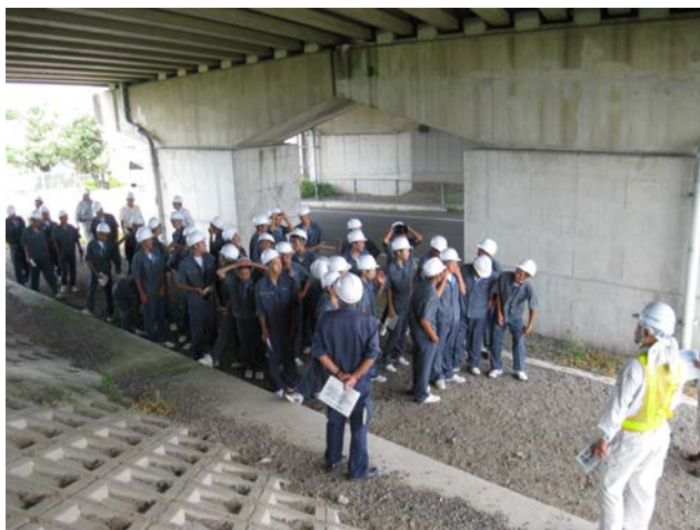
③ 【森松高架橋－現地概要説明】