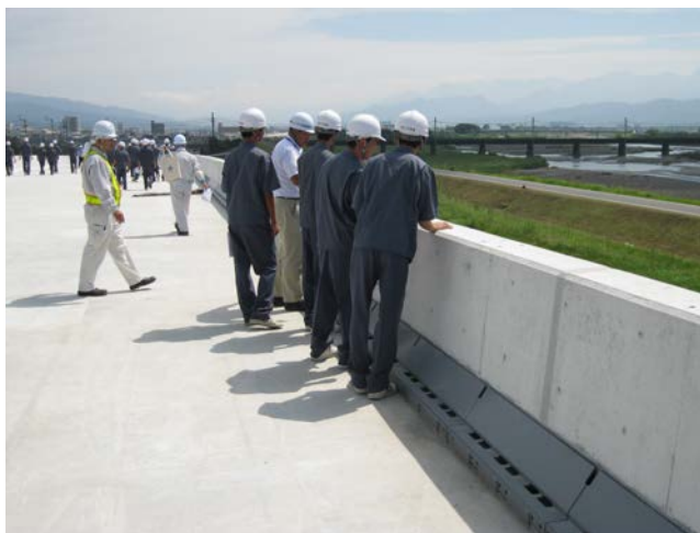
② 【松山外環状道路－現地見学状況】