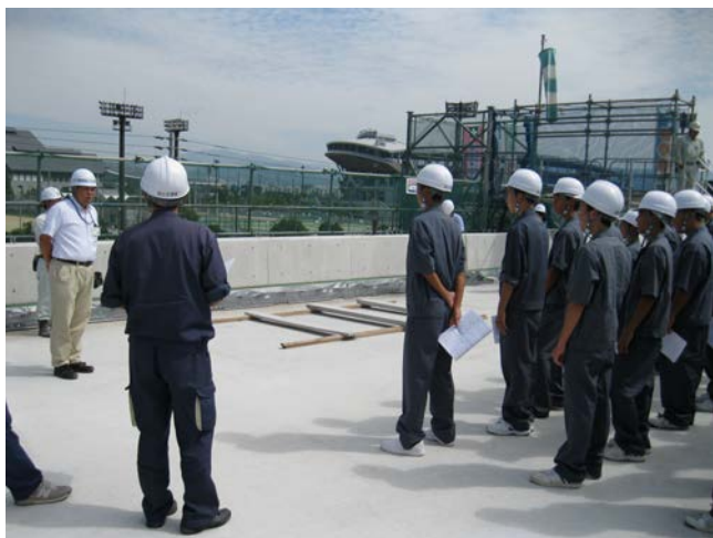
① 【松山外環状道路－現地概要説明】