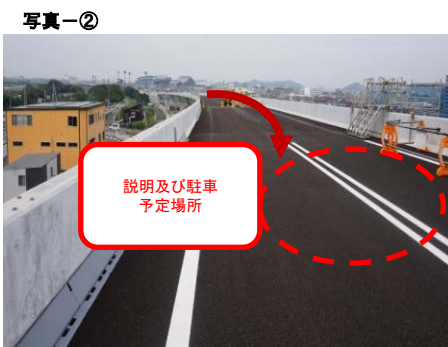
供用予定区内で駐車後、現地説明(本線上)